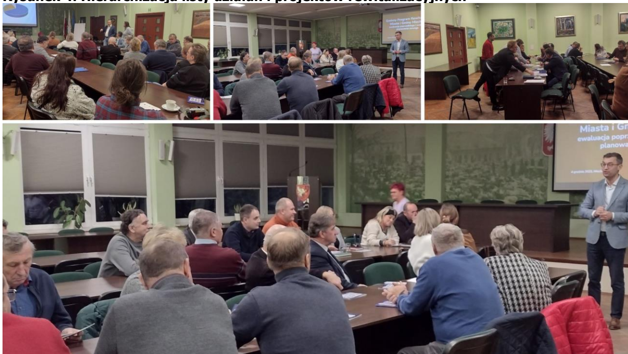
Rysunek 4. Hierarchizacja listy działań i projektów rewitalizacyjnych